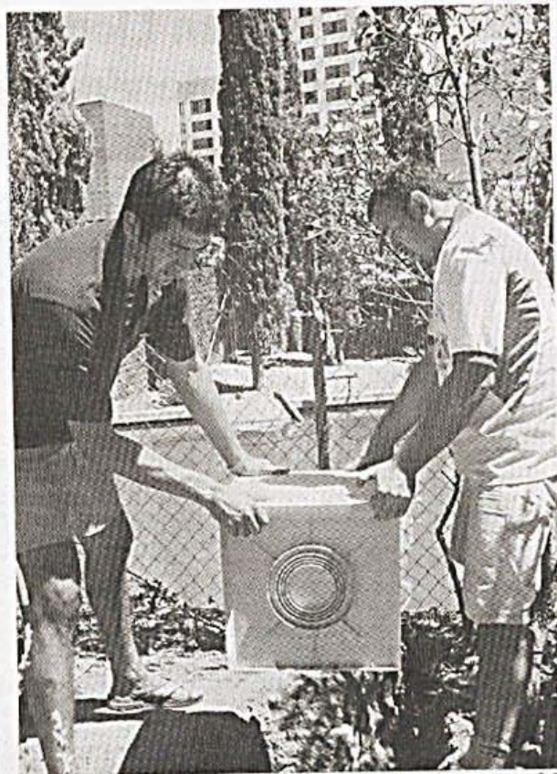
Los operarios entierran las cajas emisoras de ultrasonidos

sos colocados en este lago ornamental de Sabadell proyecta un rayo de ultrasonidos en línea recta con un alcance de 30 metros.